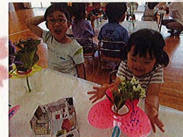
とっても満足そうな子ども達♡