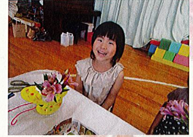
可愛くなってきたあと満足そうです♪