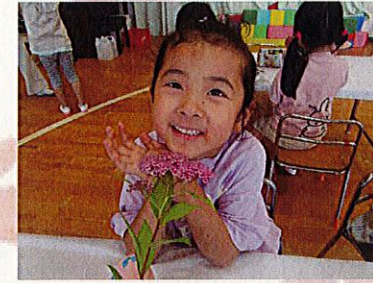
このお花手触りがフワフワするの～♪