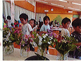
花瓶作りの後は、お花選び♪どれにしようかなあ～♪