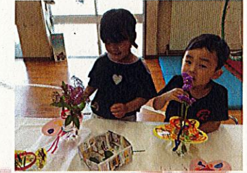
良い香りもするね！！手や鼻など五感を使ってお花に触れる姿も見られました。