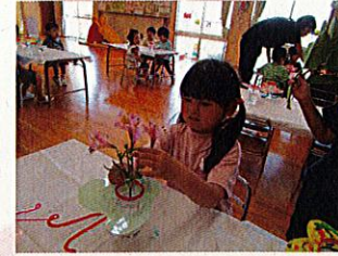
どうしたら可愛く見えるかな、綺麗に見えるかな等お花のことを思いながら生けているのでしょうか・・・表情が真剣そのものです！！