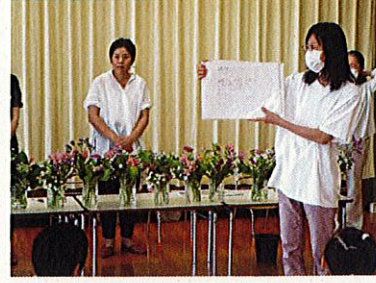
お花についての話を聞きました。