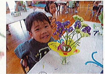
ママにプレゼントするんだあ～とキラキラした期待に満ちた表情で教えてくれました♡優しいです♡