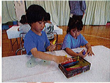
花瓶作りに挑戦！蝶々に模様を描きました。