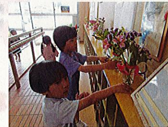
落とさないようにそーっと玄関まで運び最後まで丁寧にしている子ども達でした！！

「お花には心があるのかな？」という話をしてもらいました。それぞれの花に対して良い言葉(綺麗だね、ありがとう等)・無視をする・悪い言葉(バカ、嫌い等)をかけるとどうなるのでしょうか・・・実際に行くと無視や悪い言葉をかけ続けた花よりも、良い言葉をかけた花の方がより綺麗に咲き続けていたという話でした。花には心があるということまで理解しながら、花瓶作りから始まり一輪一輪自分達で選んだ花を花瓶に生けました。