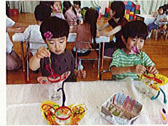
お花を大切に扱いながら生けていました☆とっても嬉しそうですね♪